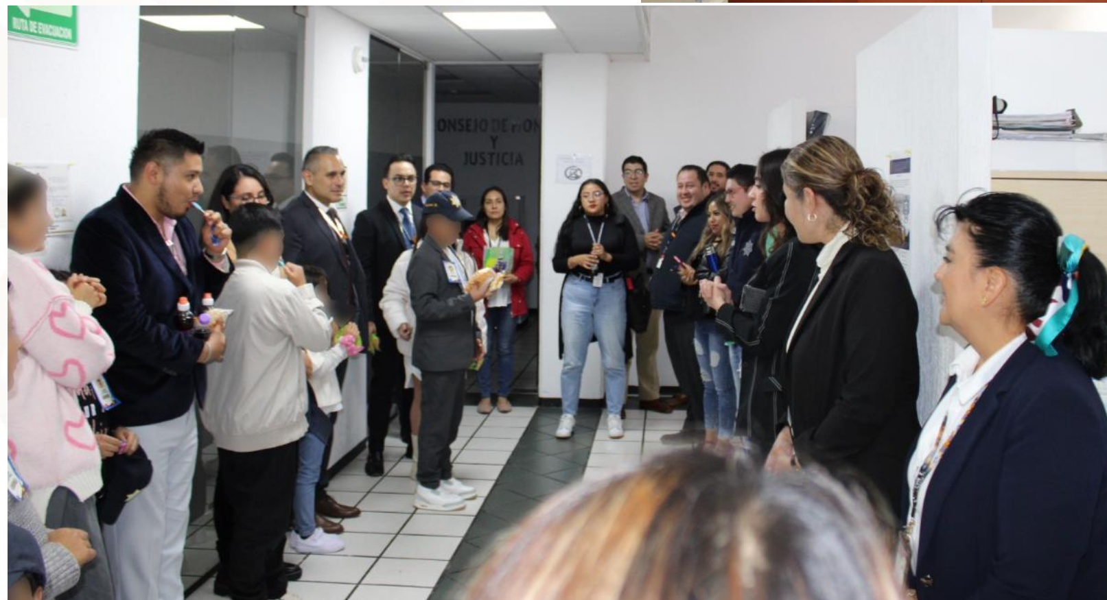
Cobertura de la actividad “Ven al trabajo con mamá o papa”